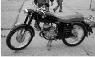
A szépséges Danuvia

Igen, jól látják, a háttérben egy farmotoros Ikarus parkol, elől jobbra egy Duna oldalkocsis Pannónia T5, mert a Pannónia nem gyártott oldalkocsikat. És meg sem említettem a magyar motorgyártás hőskorszakát, a lemezvillás, majd D és még később a 100-as, 125-ös Csepeleket, a Danuviákat, a Tünde és Panni robogókat. A Pannóniák fejlődése volt talán a legdinamikusabb, hiszen a P10-es, P20-as szé-