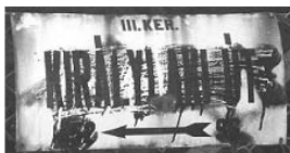
Utcatábla a hegyen...

Mit szólnának hozzá, ha mondjuk itt Óbudán, egyedi, a városrésze valamilyen módon jellemző utcatáblákkal találkozoznának egyik nap? Én nem hinnék a szememnek! Szerintem ez még az emberek hangulatát is jótékonyan befolyásolná.