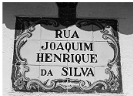
...és az ibériai félszigeten

Persze tudom, ez nem olcsó mulatság, és annyi minden, ennél sokkal fontosabb és égetőbb dolga kell a pénz. De mégis jó lenne... (Miért is szabadkozom? Hiszen egy éjszakai ügyelet kihívásánál éppenséggel életet is