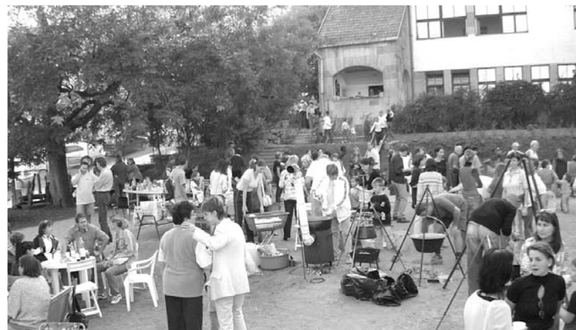
Beszámoló a 10. oldalon