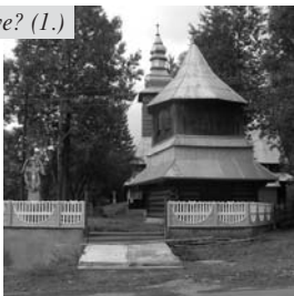
Toronya, ruszin fatemplom.

Kiss Lajos „Földrajzi nevek etimológiai szótára” c. munkája szerint első említése 1700-ból való, Toronya alakban. Nevét a közeli Turpanotkáról nyerte, melynek ma Torunka a neve. A szerző szláv eredetű névnek tartja, melyben a tulok jelentésű „tur” szó rejlik. A mai Toronya névalakja hatással volt a magyar torony főnév is.