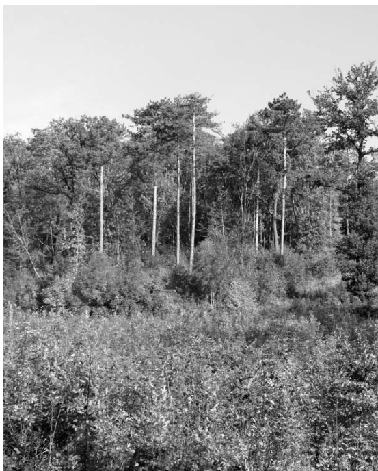
A kiöregedett fenyőerdőt a lombos újulata váltja fel

A múlt lapszámban bebarangoltuk a Hármashatár-hegyet, és megismerkedtünk a feketefenyvesek történetével. Itt az idő megtalálja a választ a télen kezdődött fakitermelésekre! Sajnos az elmúlt években a feketefenyő pusztulni kezdett. A pusztulási folyamat több tényezőre is visszavezethető, alapvető szerepe van benne a gyenge termőhelyi viszonyoknak, valamint a fák magas korának (100-110 éves fenyvesek is vannak erre felé). Az idős fákat az elmúlt két nagyon száraz nyár legyengítette, így fogékonyvá váltak a Sphaeropsis sapinea és a Cenangium ferruginosum nevű gombák fertőzésére. A fertőzés következtében a tűlevelek, a hajtáscsúcsok, súlyosabb esetben az egész hajtás vagy akár az egész fa elszárad, elpusztul. A gombák ellen védekezni nem lehet, csak megelőzni lehet a támadást a termőhelynek megfelelő fafaj ültetésével, illetve az idős állományok időben történő kitermelésével. A fertőzés fellépése után a