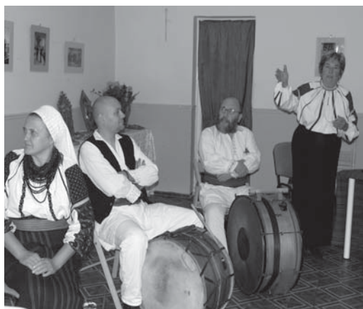
Kata meséli a képek történetét