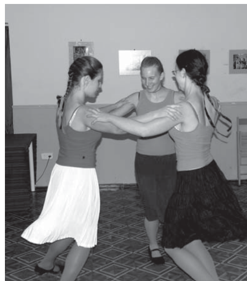
A lányok jókedve percek alatt átragadt a nézőkre