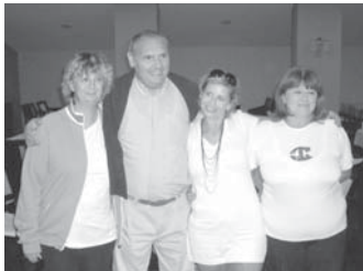
Budai Motorosok I. csapata

A hónap elején két csapatunk, a „Budai Motoros I” és a „Budai Motoros II” elfogadta a Nagykanizsai Bridzs SE hagyományteremtő szándékkal, 4 csapat részvételével rendezett bridszversenyre való meghívását.