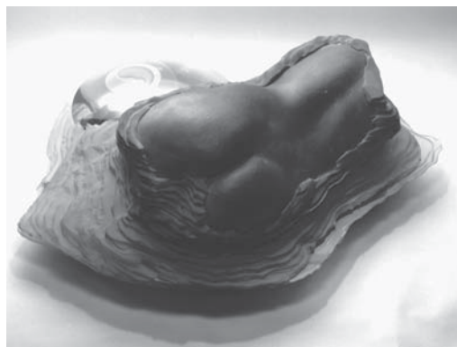
Lugossy Mária: Földanya (1994)

- Mária szobrain érezni az anyaság örömét és méltóságát, csodálatos, ahogy ezeket a mély gondolatokat, érzéseket szobrokba gondolva meg tudja fogalmazni.