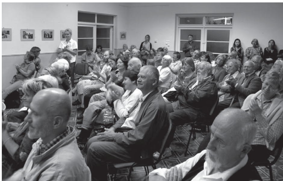
A figyelmes hallgatóság