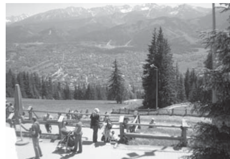
Magas-Tátra látványa a Gubalówkáról