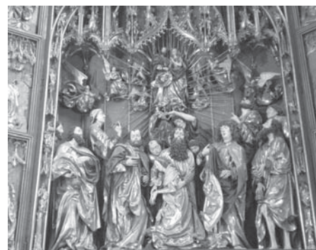
Wit Stwosz szárnyasoltára a Mária templomban