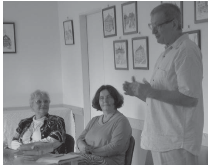
Gedeon és az előadók

A beszélgetések és koccintások zsongásában a gyertyák fényében szinte láttuk, ahogy Krúdy elégedetten csettint, azután simít bajuszán, fel teszi kalapját és felszáll, most már nélkülünk, a várakozó Vörös Postakocsira. Isten veled Szindbád, jó volt találkozni veled.