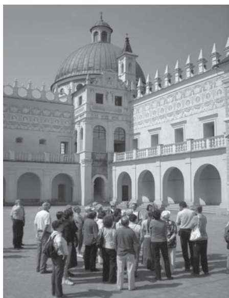
Kraciczyn reneszánsz várkastély