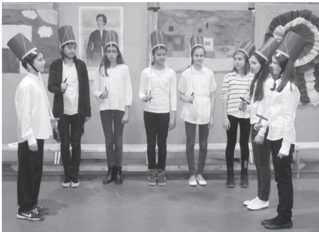
A hatodikosok Móra Ferenc egyik novelláját dramatisztálták és adták elő magas színvonalon, mindannyiunk örömeire