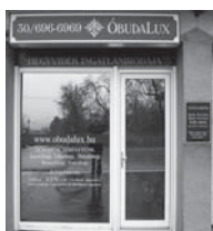
1037 Budapest, Erdőalja út 46.