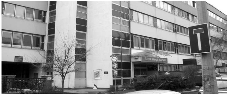
Zsákkutca? A további ágyókkentés valóban oda viszi a kórházat.

A Kórház vezetésének értékelése szerint az ilyen mértékű redukció már veszélyezteti a betegellátást, főként a belgyógyászati osztályokon, hiszen a kórháznak a kerületi lakosokon kívül kiemelt regionális feladatokat is el kell látnia, azaz még kb. 410 ezer ember részére kell fekvőbeteg ellátási háttérrel biztosítania. Féltő, hogy a kerületi betegek 30 százalékát nem tudják majd fogadni, holott az itt kezelték kb. 90 százaléka helyi lakos.