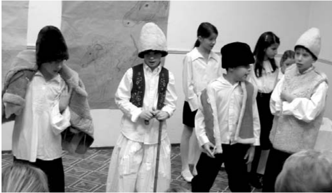
„Karácsonyi Betlehemes” a Táborhegyi Népházban

A tél folyamán több tantárgyból is készülnek kerületi tanulmányi versenyre a diákok.