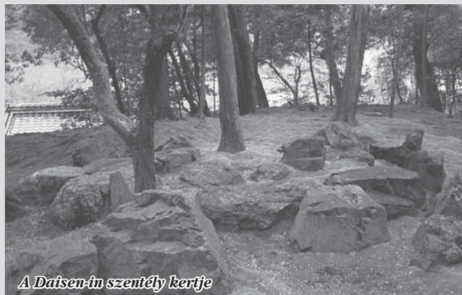
A Daisen-in szentély kertje

Japánban az örökkévalóság, és ezzel összefüggésben a kertészet