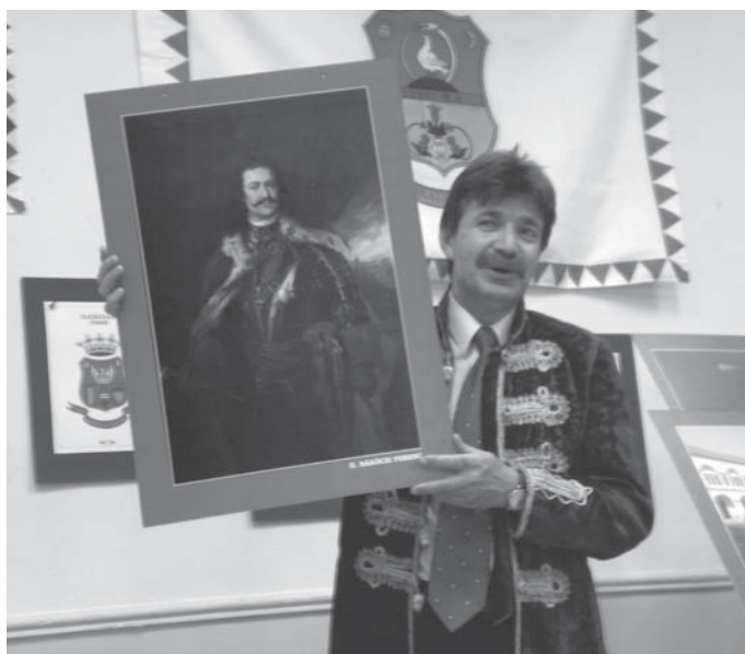
Nagy Csaba Rákóczi képével