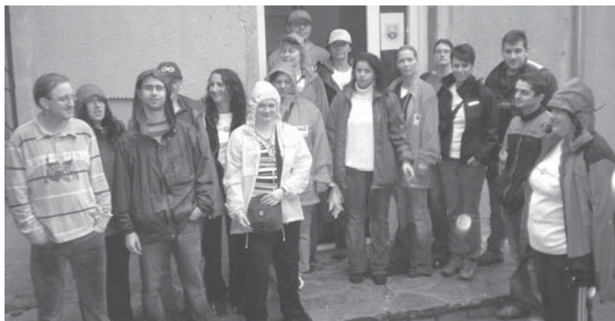
Dél fele az Otthon Centrum dolgozóit bekergette az eső, de azért vidámak voltak.

Előkészítés: Petit Typo Bt. Nyomás: MédiaPress 1990 Kft. Megjelenik: 3000 példányban