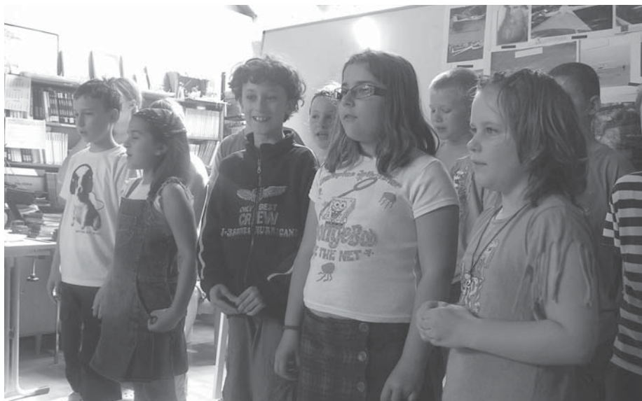
Az angol szalon 3. osztályos szereplői

Sportolóink, versenyzőink is sikeres évet zártak.