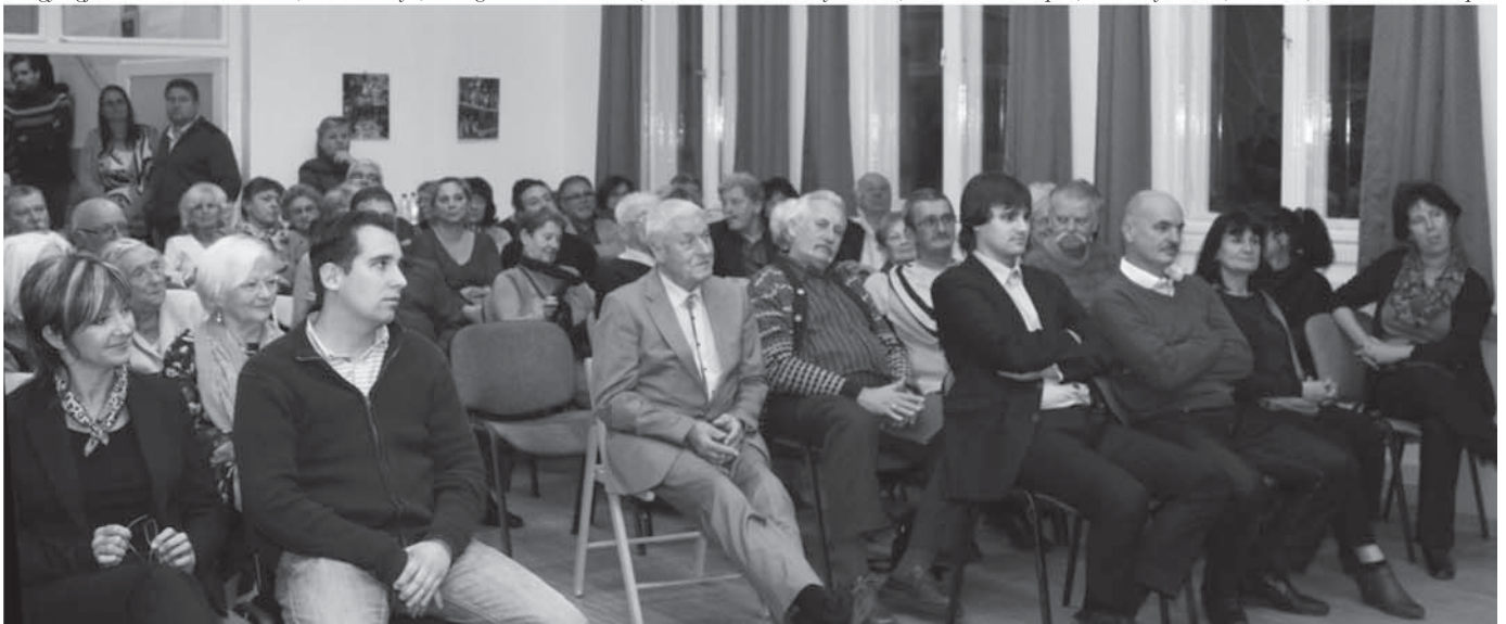
Az 1989-ben alakult Óhegy Egyesület 25. szülinapját ünnepelte. Ez alkalomból megjelentek az Egyesület tagjai, területi képviselőink, szimpatizánsaink.